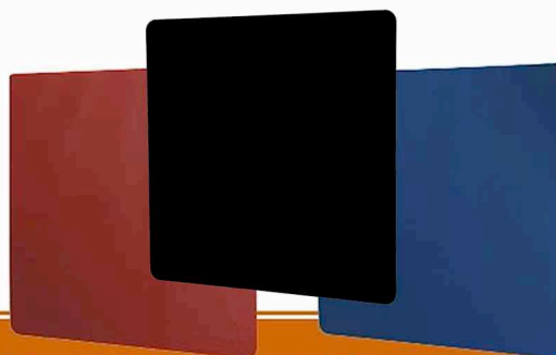
Farben: Schwarz / Rot / Blau